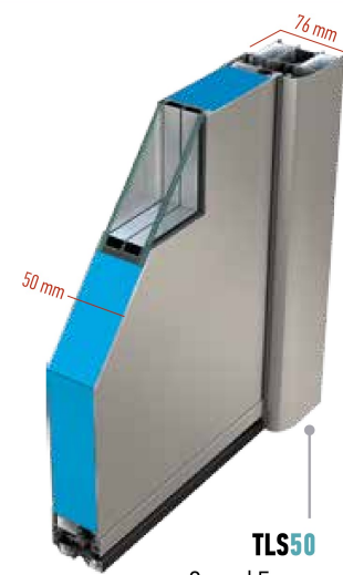
TLS50 Curved Frame Telaio Curved / Dormant Arrondi