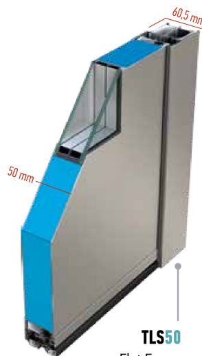
TLS50 Flat Frame Telaio Flat / Dormant Plat